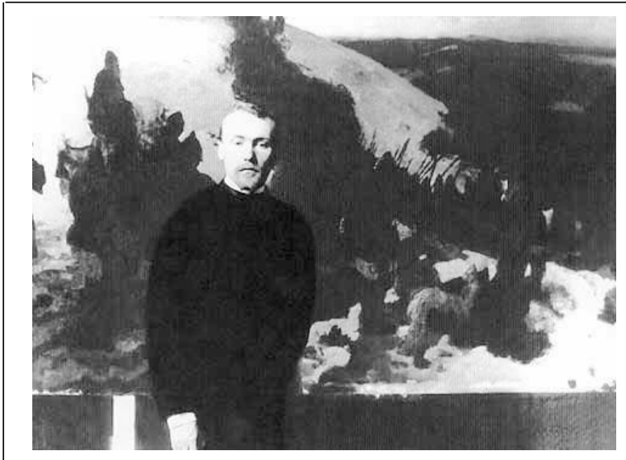
Н.К. Рерих в своей мастерской перед картиной «Поход». 1899.